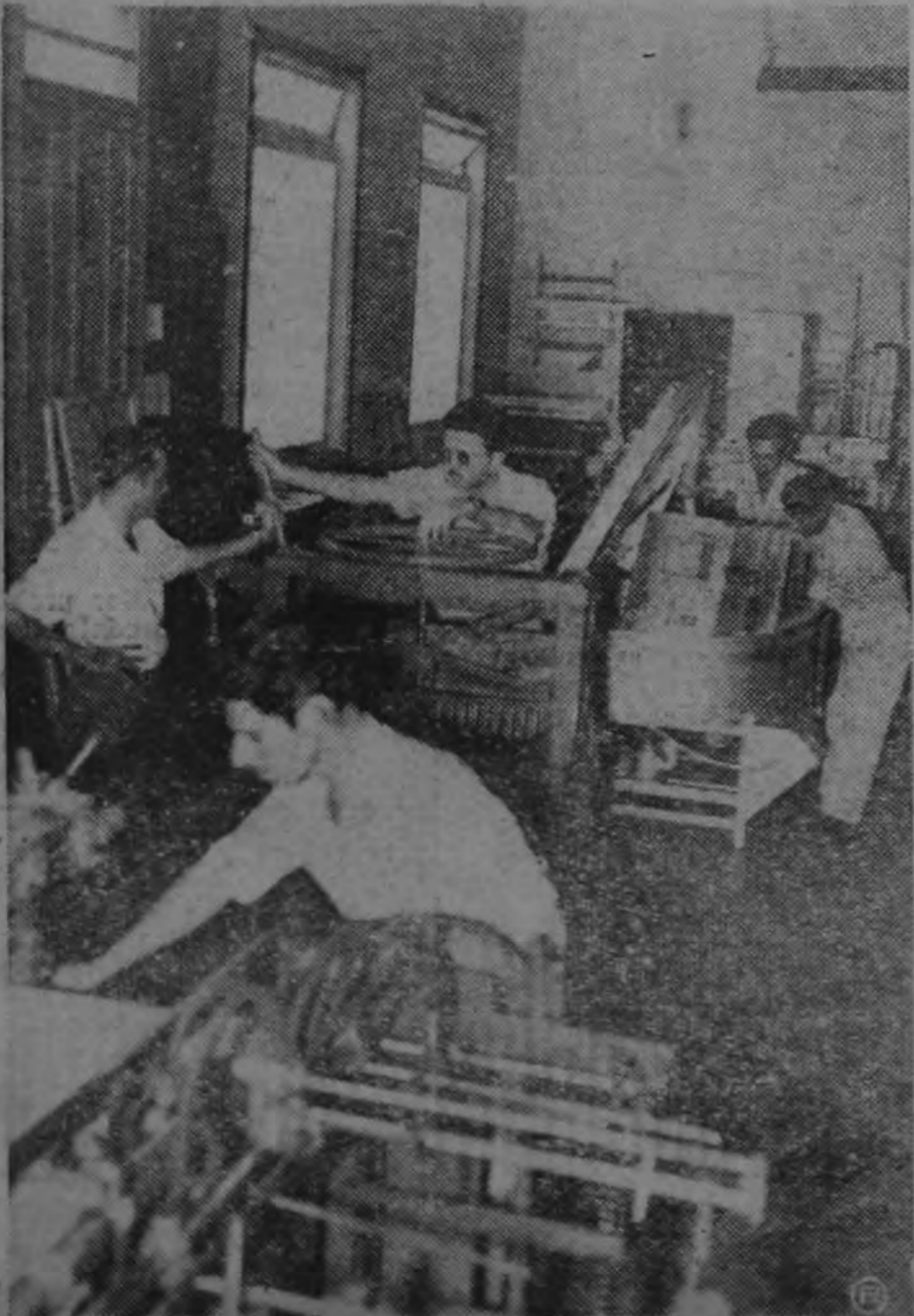
Estas dos fotografías muestran parte del moderno equipo con que trabaja el Instituto Geográfico Nacional. La foto superior corresponde al Multiplex, que permite, mediante un interesante sistema óptico, apreciar los relieves del suelo en planos fotografiados desde el aire. El resto de las instalaciones, que parcialmente se aprecian en la foto de abajo, forma parte de un vasto mecanismo que está completándose y que comprende también la impresión de mapas y otros importantes trabajos cartográficos.