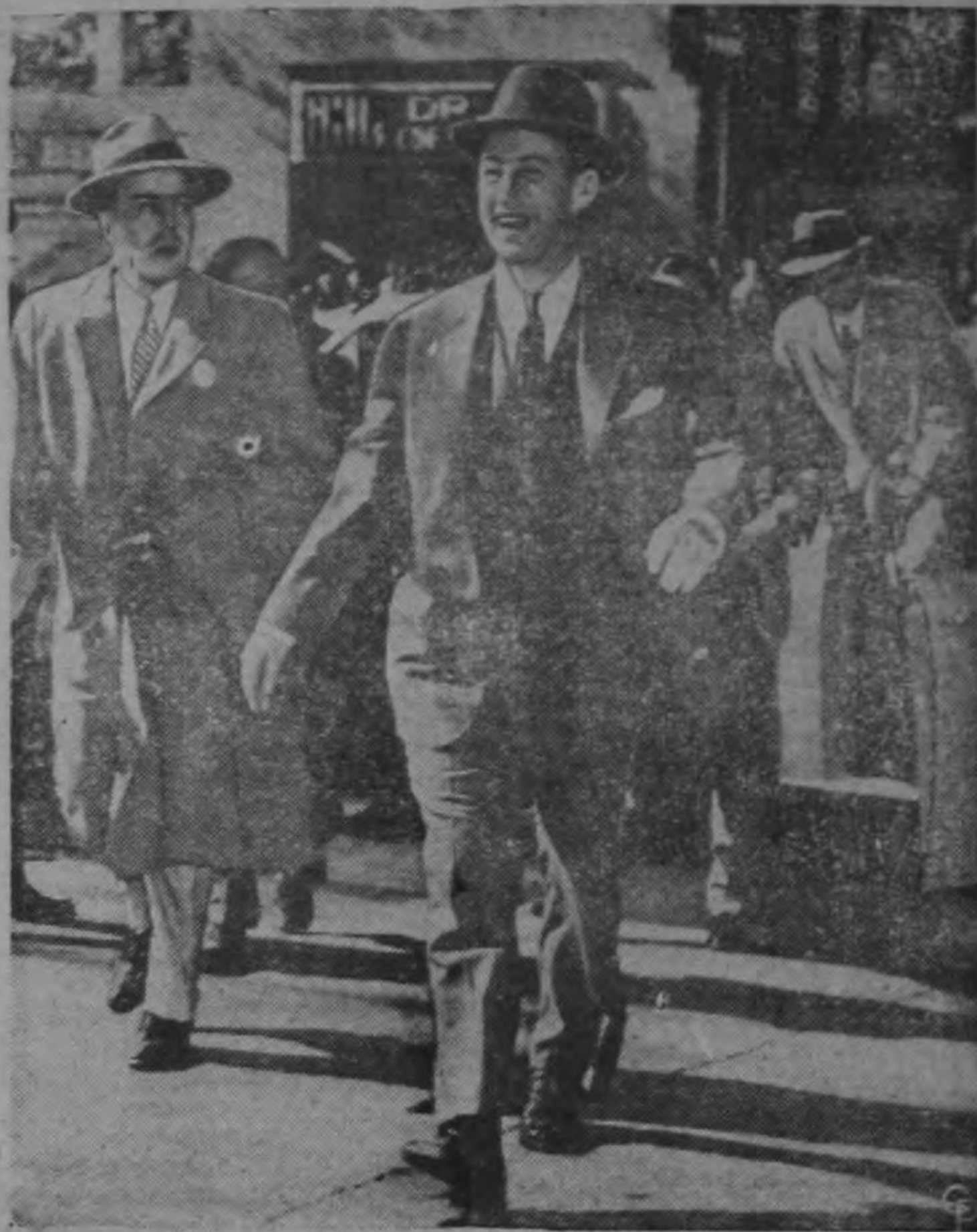
El candidato demócrata Adlai Stevenson cruza rápidamente las calles de Madison, en el Estado de Wisconsin, a fin de llegar a la hora exacta a la cita que tiene en un hotel.