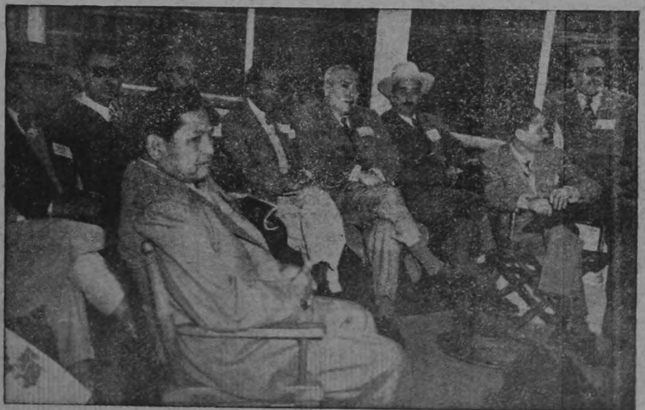
A bordo del yate "Buen Vecino", de la Junta de Comisionados del Puerto de Nueva Orleans, el grupo de periodistas latinoamericanos invitados por la Casa Internacional de esa ciudad efectuó una visita de inspección a las obras portuarias. En la foto aparece una parte del grupo de colegas que, en representación de todos los países de Centro América, Panamá y México, fueron huéspedes de importantes instituciones norteamericanas.