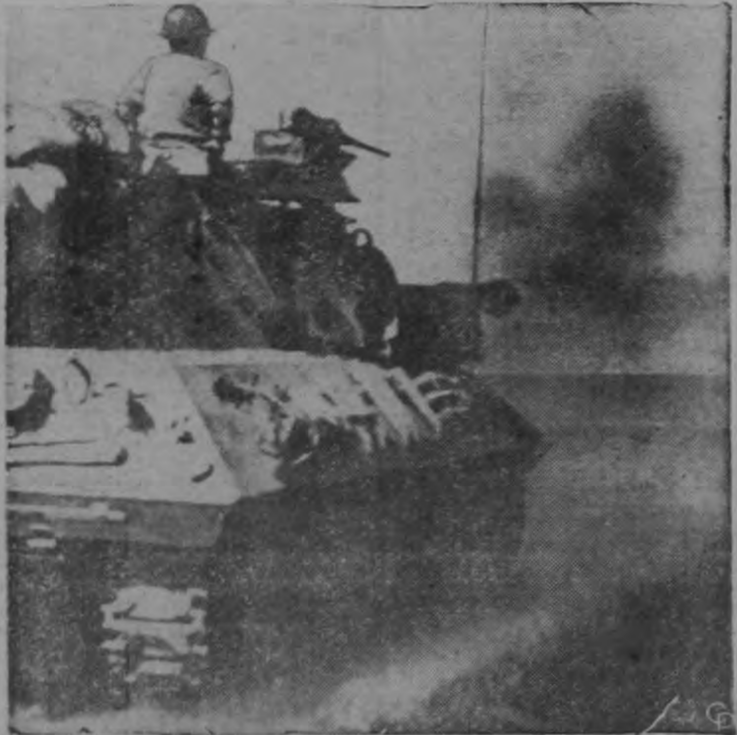
Un tanque aliado toma parte en el ataque final por la posesión de la estratégica colina "Caballo Blanco", en el frente coreano. Más de diez mil soldados rojos murieron en esa batalla.

Fernando Vargas F. — Gonzalo Ortiz M. — Alvaro Torres V.