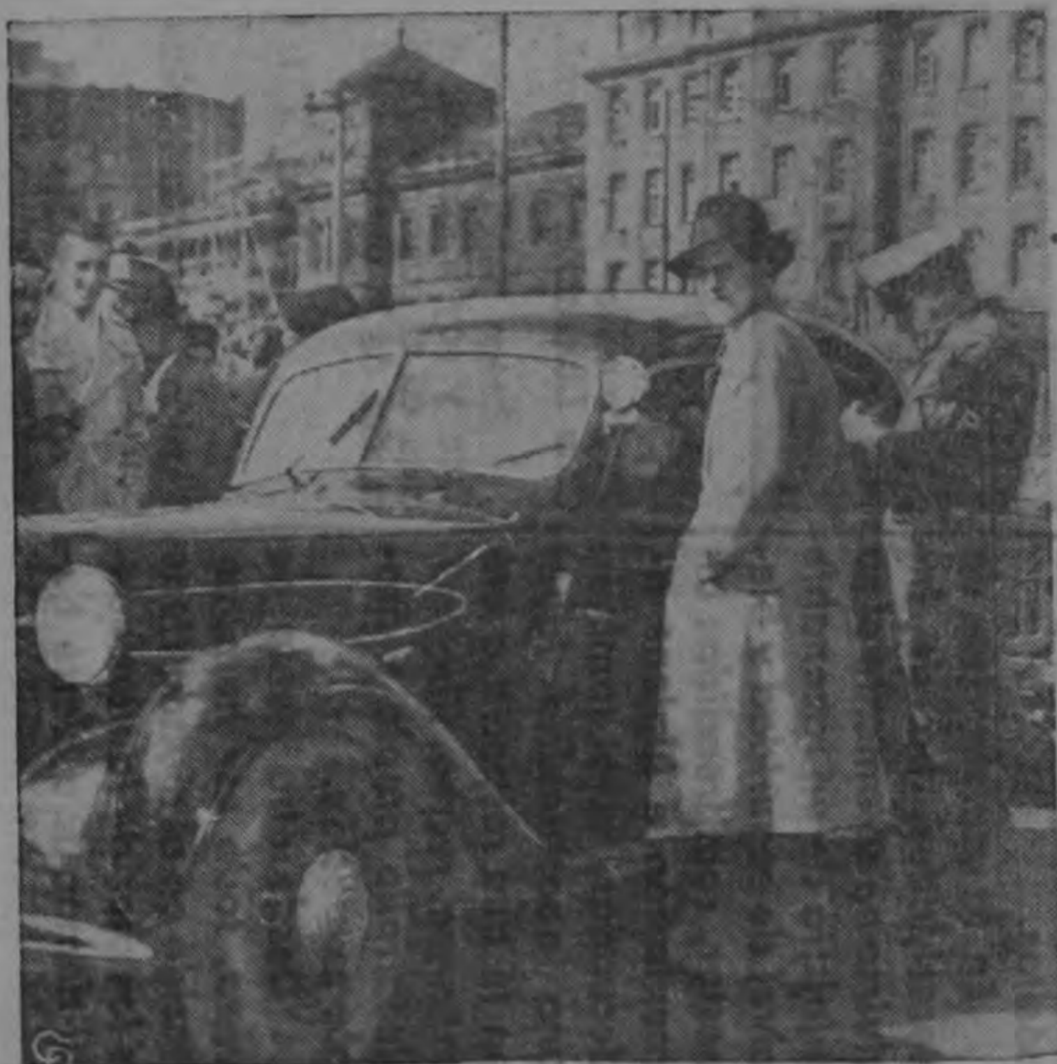
Los alemanes que se ven al fondo sonrien divertidos mientras un policía militar norteamericano notifica una multa por infracción del reglamento de tránsito al chauffeur de un automóvil de la Misión Militar Soviética en Francfort. El chauffeur rojo no se detuvo ante la luz roja de parada y chocó con otro vehículo.