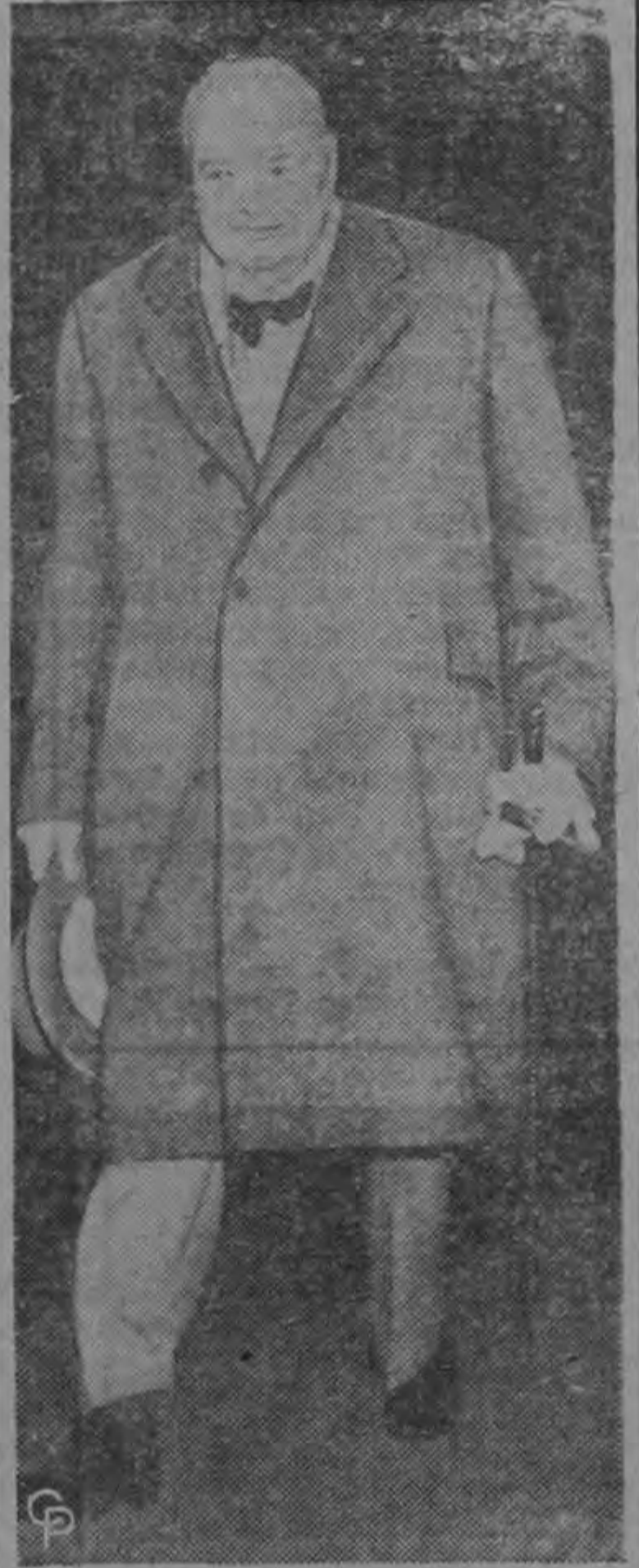
El Primer Ministro británico Winston Churchill llega a Scarborough, para asistir a la reunión anual del Partido Conservador.