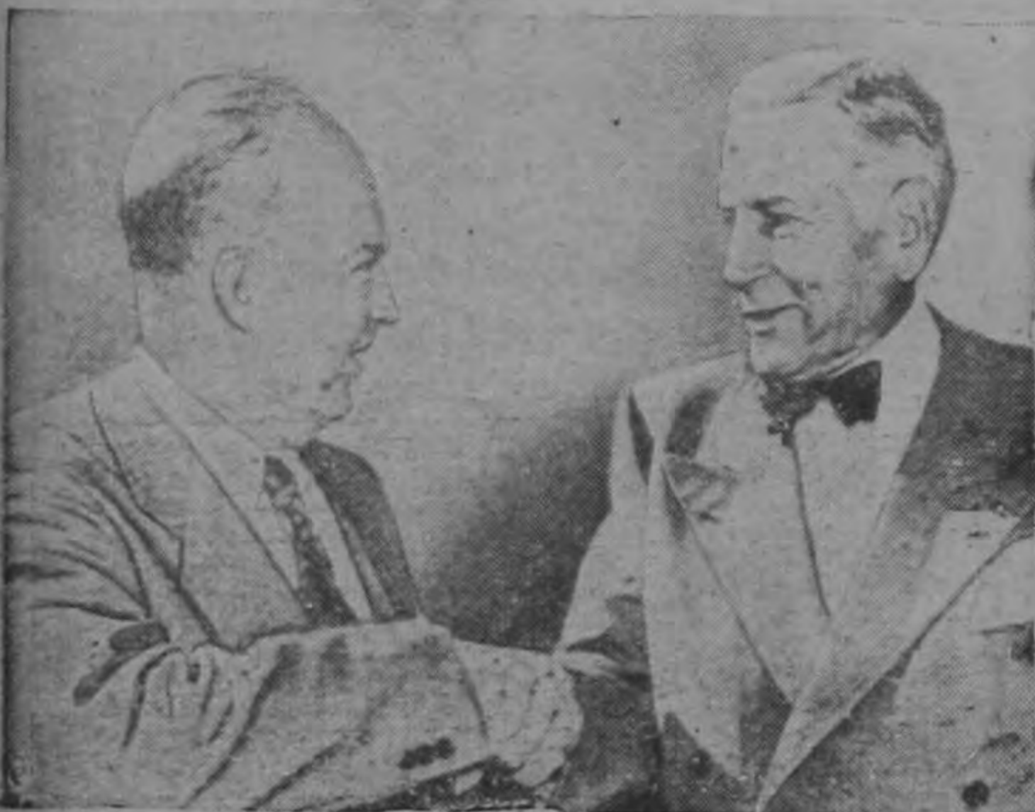
El General Eisenhower saluda a Pat Hurley durante una parada en Albuquerque, Nueva México. Hurley es candidato republicano a la senaduría por ese Estado, y en alguna ocasión tuvo al "Mayor Eisenhower" como subalterno suyo.