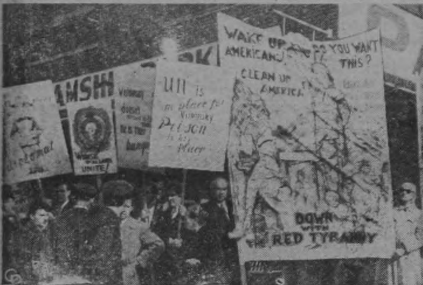
El Embajador soviético en Gran Bretaña, Andrei Gromyko (izquierda), se muestra impasible; y el Ministro de Relaciones Exteriores de Rusia, Andrei Vishinsky, se exhibe con gesto de irónica insolencia ante la manifestación anticomunista con que fueron recibidos a su paso por el Bronx, en Nueva York, después de su llegada en el "Queen Elizabeth", para asistir a la Asamblea General de las Naciones Unidas.